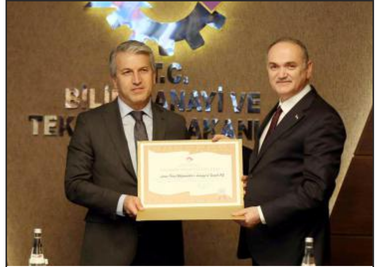
Cemer A.Ş. Yönetim Kurulu Başkanı Fuat Eroğlu, belgesini, Bilim, Sanayi ve Teknoloji Bakanı Faruk Özlü'nün elinden aldı.

Engellilerin kullanabileceği ve bazı duyguları deneyimleyebileceği yeni tasarımlar üzerinde çalıştıklarını belirten Eroğlu, "Ayrıca yine Türkiye'de bir ilke imza atarak, Ar-